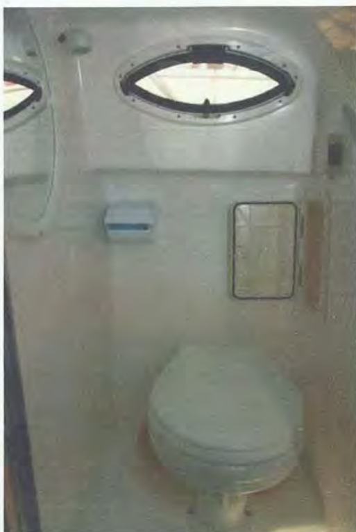
Es de agradecer la presencia de una estancia privada como el lavabo en una embarcación de eslora contenida.