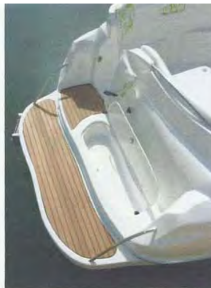
Práctico cofre con desagüe para alojar momentáneamente aletas, gafas y tubos de los niños.