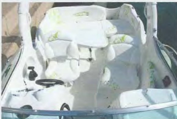
La disposición de los espacios es cómoda para cuatro personas, especialmente al fondear ya que las butacas son reversibles.

El brío con que su motor empuja un casco ligerito es un gran atractivo para cualquier patrón.