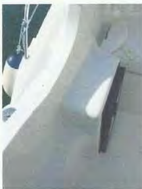
Detalle de uno de los cómodos accesos a las bandas.