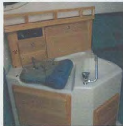
El coqueto mueble de la cocina ofrece el espacio suficiente para pasar algunos días fuera.

Bajo el puente de mando se halla la cama-conejera orientada transversalmente y separada del resto del habitáculo mediante una cortinilla. De unas buenas dimensiones tanto longitudinalmente como de altura sobre la cama, caben dos personas cómodamente no existiendo sensación de agobio por claustrofobia. A los pies de la cama, existe un espacio para la colocación de enseres personales sin mucho orden. Los costados están tapizados ofreciendo una agradable sensación de confort. Un portillo facilita la ventilación y la entrada de luz.