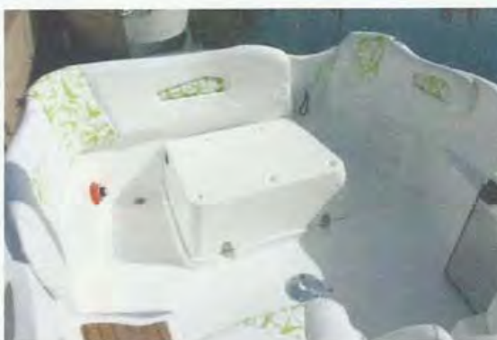
Al quitar los módulos del banco queda al descubierto la tapa del motor y delibera espacio útil para la pesca.