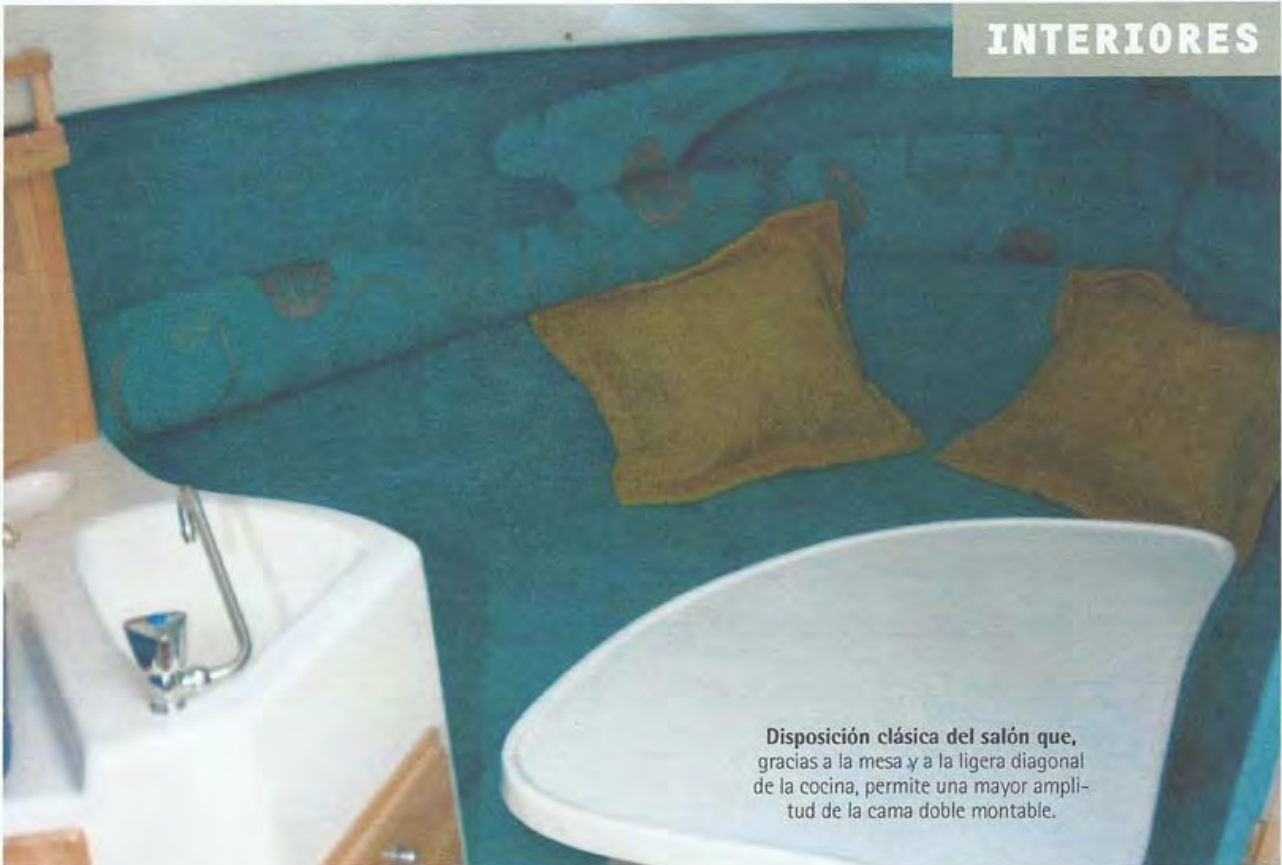
Disposición clásica del salón que, gracias a la mesa y a la ligera diagonal de la cocina, permite una mayor amplitud de la cama doble montable.