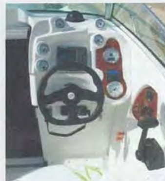
Completo cuadro de mandos con los relojes bien orientados. La ubicación del mando del gas es cómoda.

Sus 7,10 m de eslora están suficientemente aprovechados en la proa como para instalar dos colchonetas encima de la sobreestructura. Por sus pasillos laterales bien protegidos por los candeleros que llegan más arriba de la rodilla, se accede a la bañera por los necesarios peldaños dispuestos. Ésta está compuesta por un banco modular que al quitar sus tramos deja al descubierto la tapa del motor estanca que permite un fácil y directo acceso al motor. Unos mullidos respaldos excelentemente tapizados